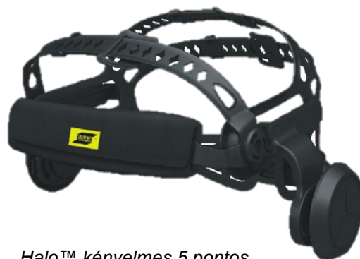
Halo™ kényelmes 5 pontos fejpánt (előlnézet)

Bővebb tájékoztatás az esab.com oldalon található.