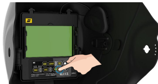
Magas optikai osztályú ADF színes érintőképernyős kijelzővel